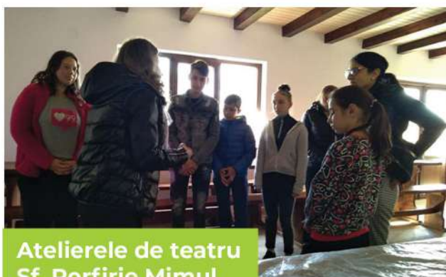
Atelierele de teatru Sf. Porfirie Mimul

Prin contribuția ATOR Iași și a altor donatori parohia noastră oferă 5 burse lunare în valoare de 200 lei elevilor merituoși din comunitate.