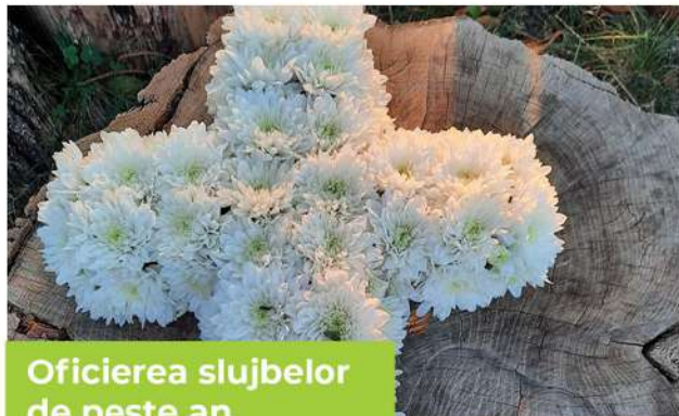
Oficierea slujbelor de peste an

Am oficiat slujbele rânduite peste an de Biserica Ortodoxă Română pentru amintirea patimilor, morții și învierii Domnului nostru Iisus Hristos, pentru preamărirea adusă lui Dumnezeu și pentru cinstirea sfinților Săi. Am săvârșit Taina Sfântului Maslu pentru credincioșii noștri, împreună cu frații preoți din cadrul cercului misionar, precum și alte ierurgii pentru sănătatea, buna-sporire și mântuirea enoriașilor noștri. De asemenea, am organizat cu mult drag, în fiecare an, pe data de 21 mai, sărbătoarea hramului bisericii noastre.