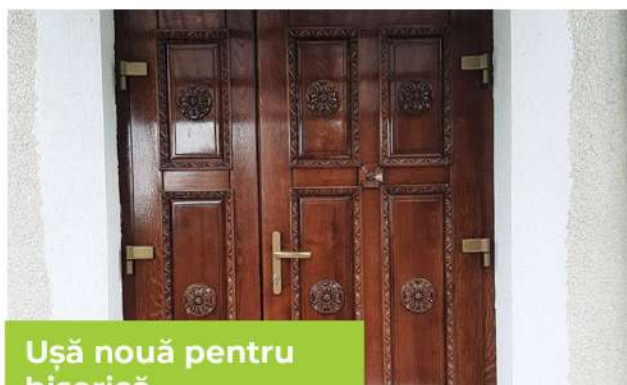
Ușă nouă pentru biserica

Prin contribuția enoriașilor și a multor donatori de pretutindeni, am reușit în anul 2019 să împlinim o lucrare esențială pentru comunitatea noastră: o fântână cu apă curată, rece și limpede.