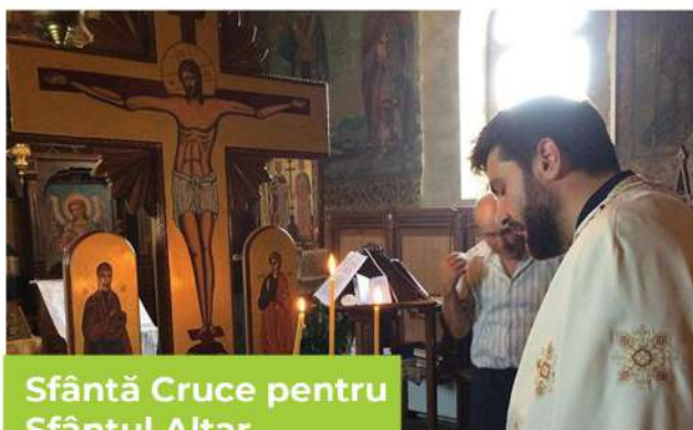
Sfântă Cruce pentru Sfântul Altar

Am oficiat slujbele rânduite peste an de Biserica Ortodoxă Română pentru amintirea patimilor, morții și învierii Domnului nostru Iisus Hristos, pentru preamărirea adusă lui Dumnezeu și pentru cinstirea sfinților Săi. Am săvârșit Taina Sfântului Maslu pentru credincioșii noștri, împreună cu frații preoți din cadrul cercului misionar, precum și alte ierurgii pentru sănătatea, buna-sporire și mântuirea enoriașilor noștri. De asemenea, am organizat cu mult drag, în fiecare an, pe data de 21 mai, sărbătoarea hramului bisericii noastre.