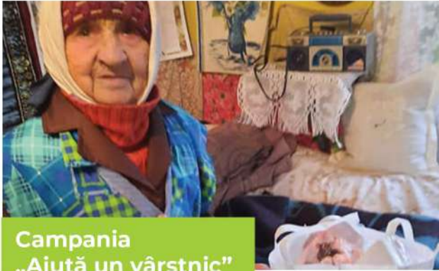
Campania „Ajută un vârstnic”

Prin contribuția unor oameni iubitori, bătrânii parohiei noastre au primit daruri în fiecare an, cu ocazia Nașterii și Învierii Domnului nostru Iisus Hristos.