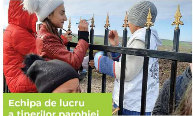
Echipa de lucru a tinerilor parohiei

Prin contribuția unor oameni iubitori, bătrânii parohiei noastre au primit daruri în fiecare an, cu ocazia Nașterii și Învierii Domnului nostru Iisus Hristos.