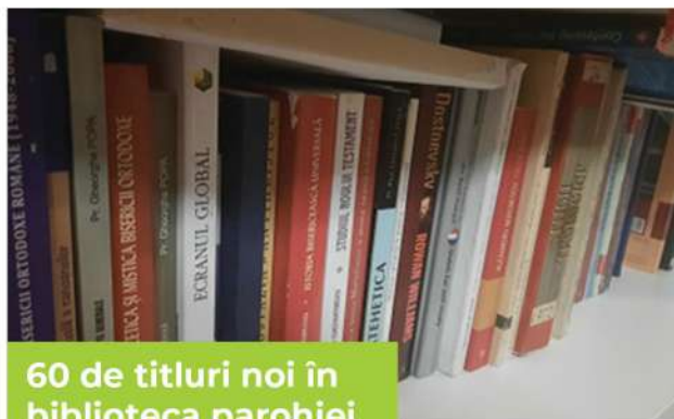
60 de titluri noi în biblioteca parohiei

Un proiect dedicat tinerilor parohiei pentru familiarizarea cu mesajul lui Dumnezeu. Atelierele au avut ca finalitate participarea unui număr de 5 tineri la Concursul de Noul Testament organizat pe 12 decembrie 2020 de Arhiepiscopia Iașilor.