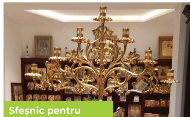
Sfeșnic pentru Sfântul Altar

Am reușit ca până la finalul anului 2020 să închegăm un cor al parohiei format din tinerii comunității.