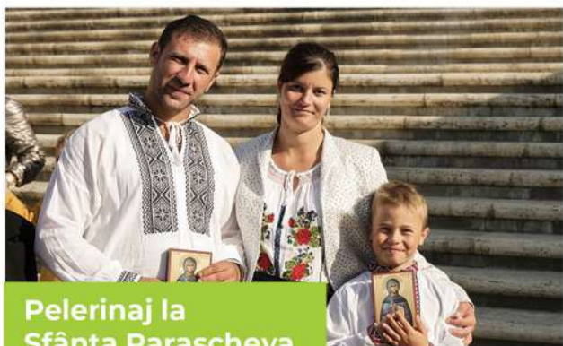
Pelerinaj la Sfânta Parascheva

Am organizat în luna octombrie 2019 un pelerinaj cu 20 de enoriași la moaștele Sfintei Parascheva, cea mult folositoare.