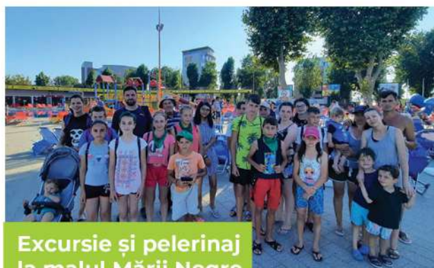
Excursie și pelerinaj la malul Mării Negre

O acțiune dedicată tinerilor parohiei, organizată la finalul anului 2019: am vizionat la cinema filmul animat Toy Story 4, am vizitat orașul Iași și ne-am închinat la moaștele Sfintei Parascheva.