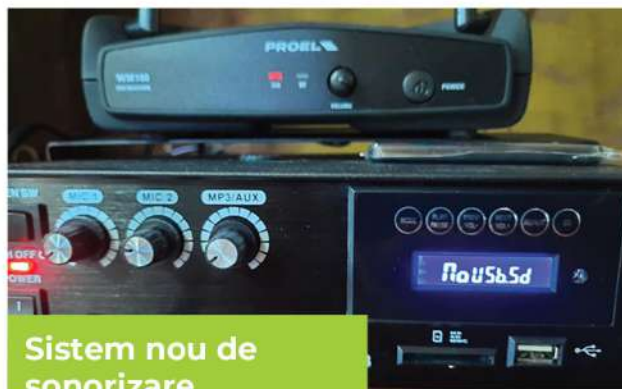
Sistem nou de sonorizare

Am primit în anul 2019, din partea Parohiei „Sf. Haralambie” din Iași seturi de veselă complete pentru deservirea casei noastre praznicale.