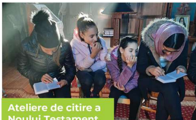
Ateliere de citire a Noului Testament

Un proiect dedicat tinerilor parohiei pentru familiarizarea cu mesajul lui Dumnezeu. Atelierele au avut ca finalitate participarea unui număr de 5 tineri la Concursul de Noul Testament organizat pe 12 decembrie 2020 de Arhiepiscopia Iașilor.