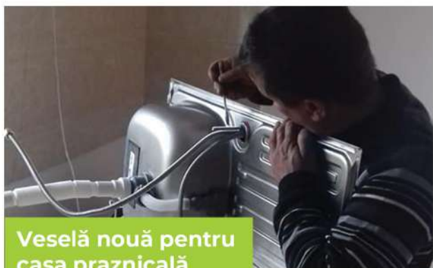
Veselă nouă pentru casa praznicală

Am primit în anul 2019, din partea Parohiei „Sf. Haralambie” din Iași seturi de veselă complete pentru deservirea casei noastre praznicale.