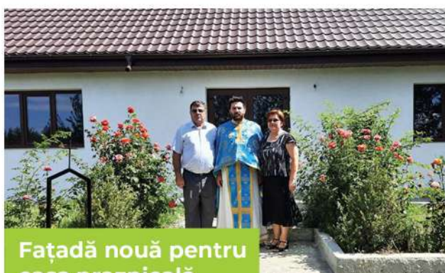
Fațadă nouă pentru casa praznicală

Fântâna fiind finalizată, am reușit să racordăm la apă casa praznicală.