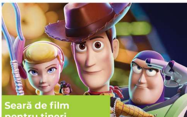
Seară de film pentru tineri

Am organizat în luna octombrie 2019 un pelerinaj cu 20 de enoriași la moaștele Sfintei Parascheva, cea mult folositoare.